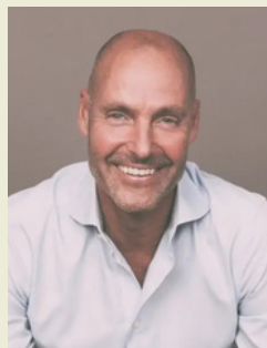
Martin Svedar Valberedningen